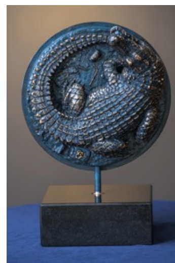
New York City Legend 2022, limiterad upplaga om 49 signerade ex (27 cm diameter).

Temat för verket är legenden om alligatorn i New Yorks kloaker. Så sent som i mars i år rapporterade New York Times om en alligator som hittades i Brookly. Alligatorer som husdjur kom först på tal under 30-talet, då baby-alligatorer från just Florida fanns till försäljning. Enligt myten släpptes de sedan ut av oansvariga ägare som inte längre vill ta hand om dem.